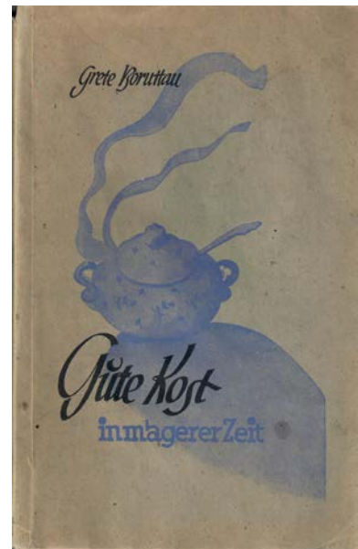
Rezepte für magere Zeiten – ein Kochbuch aus der Nachkriegszeit

Obst, Gemüsesorten und Gerichte aus aller Welt zu uns kamen (10.8.). Treffpunkt ist jeweils um 14.00 Uhr beim Öschelbronner Platz. Zusätzlich zum Eintritt fallen keine Kosten an.