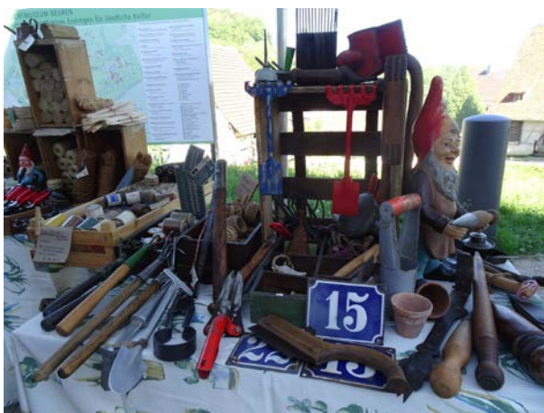
Schön und praktisch - alte Gartengeräte

Dazu gab es jede Menge Informationen über die Gärten des Freilichtmuseums, das Sortenretter Netzwerk Genbänkle als Kooperations-Partner, die Rekultivierung alter Getreidesorten, ein Bäuerinnen-Projekt in Gambia, sowie Tipps zum richtigen Standort und Pflege der Setzlinge. Großen Anklang fand die Anleitungen des Genuss-Teams zur Herstellung von Kräutersalz sowie