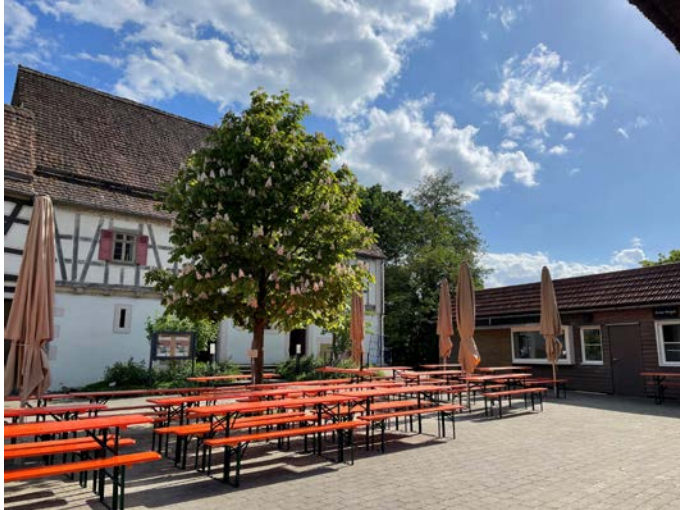
Die Kastanie im Biergarten hat der Förderverein gespendet.