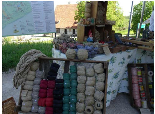
eine Rarität: Alte Binfäden und Garne aus den 1940er Jahren

Neben Pflanzenraritäten lockten Stände mit Cidre, Ölen, Honig, badischen Erdbeeren, Gemüse und Käse die Kundschaft an. Naturseifen, antiquarische Bücher und Gartengeräte sowie alte reißfeste Binfäden aus Hanf und Leinen aus den Beständen einer aufgelassenen Seilerei aus Wilhelmshaven aus den 1940er Jahren sorgten für zusätzliche Vielfalt des Angebots.