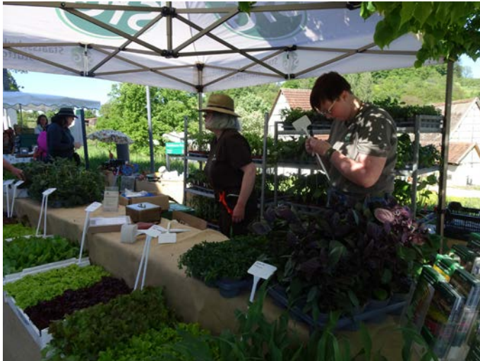
Vor allem historische Gemüsesetzlinge waren gefragt.

Selbst geübte Hobby-Gärtner staunten über die Fülle an verschiedenen Tomatensorten, die auf dem 11. Garten- und Genussmarkt just am 11. Mai im Freilichtmuseum angeboten wurden. Die meisten Besucher hatten Körbe und Taschen mitgebracht, um sich mit seltenen Stauden und Gemüsesetzlingen einzudecken. Vor allem historische Sorten waren im Angebot, die sonst nur schwerlich zu bekommen sind. Auch der Stand mit alten Erdbeersetzlingen wie Mieze Schindler zog viele Liebhaber an.