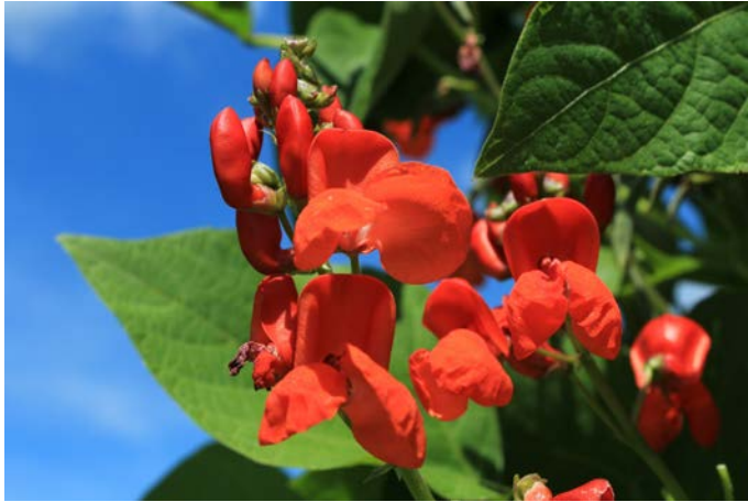
Die Feuerbohne stammt ursprünglich aus Südamerika

So, 22. Juni 2025, 14.00 Uhr: Von der Speisekammer zur Kühltruhe. Der Rundgang endet im Erlebnis.Genuss.Zentrum, wo das Genuss-Team „Buntes Gemüse“ kocht.