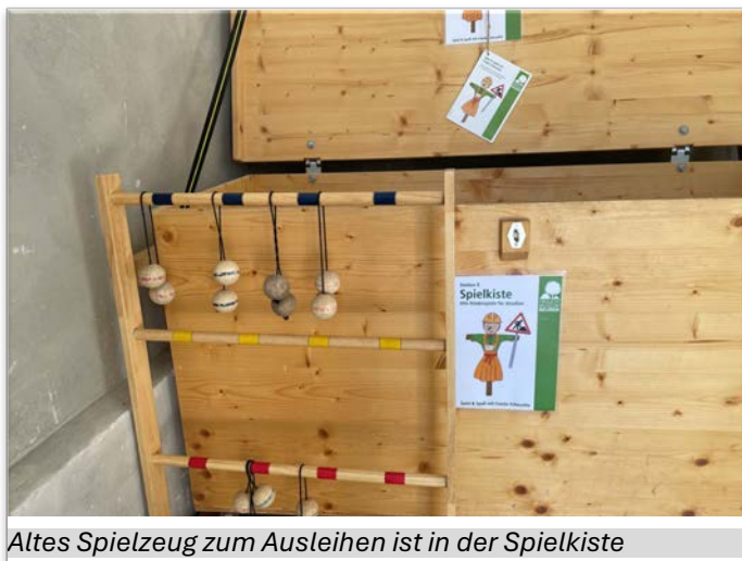
Altes Spielzeug zum Ausleihen ist in der Spielkiste

Verstecken und Fangen, Seilspringen und Gummitwist, Ball- und Hüpfspiele – ohne großen Materialaufwand, aber mit viel Fantasie hatten auch früher schon Kinder Spaß beim Spiel und übten Bewegungsabläufe und Geschicklichkeit. Einen Nachmittag rund um die Kinderspiele der Großeltern bietet das Freilichtmuseum am Sonntag, den 8. Juni beim neuen Themenspielplatz an.